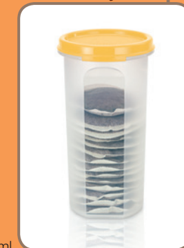
Rondovision 650 ml